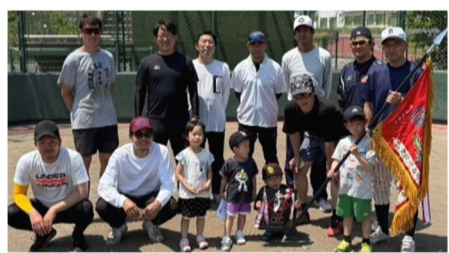
チーム一丸となり、つかんだ栄冠!