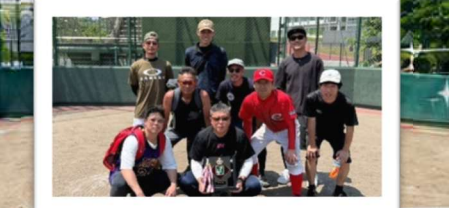
最後まで粘り強く戦いました!